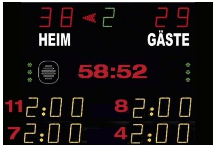
Abbildung 1: Beispiel Anzeigetafel

In allen Hallen, auch dort, in denen öffentliche Zeitmessanlagen vorhanden sind, ist eine vorwärtslaufende Tischstoppuhr mit einem Mindestdurchmesser des Ziffernblattes von 21 cm oder eine digitale Tischstoppuhr mit einer Anzeigengröße von mindestens 175 x 130 mm einzusetzen. Öffentliche Zeitmessanlagen dürfen nur verwendet werden, wenn der Betriebsmodus "vorwärts" möglich ist. Die Spielzeit muss von Minute 00 bis Minute 60 hochlaufen. Eine Teilung der Halbzeiten in jeweils 30 Minuten, wobei die 2. Halbzeit wieder bei 00 Minuten beginnt, ist somit nicht gestattet. Außerdem sind je zwei Aufsteller für Team-Time-out-Karten und Hinausstellungszeiten zu platzieren. Bei Verwendung der öffentlichen Zeitmessanlage ist das Automatikhorn als Schlussignal verpflichtend.