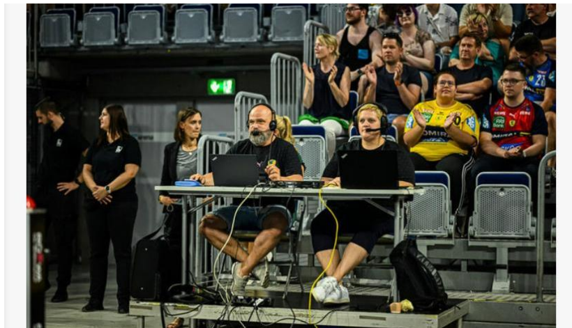
Abbildung 4: Optimale Umsetzung eines Scouterplatzes

Es müssen vom Heimverein zwei, nicht sichtbehinderte (Arbeits-) Plätze in der Halle auf Höhe der Mittellinie zur Verfügung stehen. Diese müssen mit einem Tisch sowie einem Strom- und Internetanschluss (LAN – kein WLAN) ausgestattet sein.